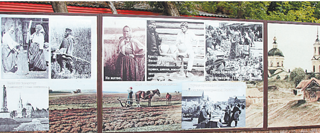
■ История района в фотоснимках.