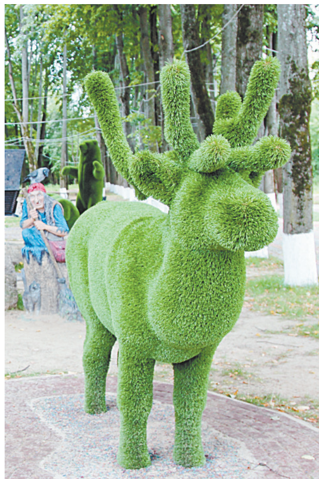
■ Фигуры животных — настоящий магнит для селфи.