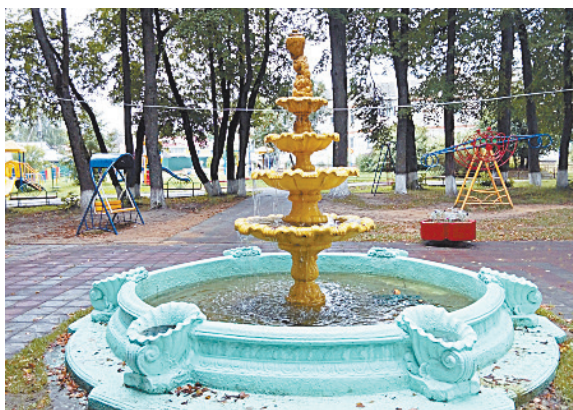
■ Маленький Петергоф.