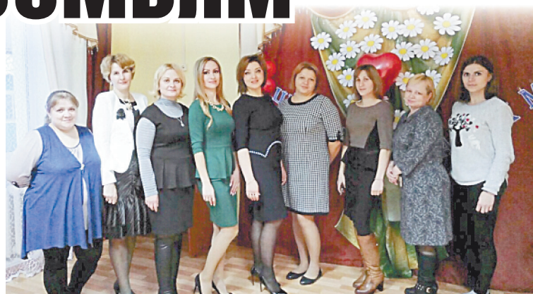
■ Коллектив социально-реабилитационного центра «Черемушки».

многодетные и молодые семьи и матери-одиночки. В Спас-Деменске сегодня зарегистрирована 81 многодетная семья, и с каждой из них контактируют представители центра. Этим занимается отделение по профилактике детского и семейного неблагополучия. По сути, эту работу можно назвать социальным патронажем, причем во главу угла ставятся не инспекция и контроль, а диалог, выявление проблем и помощь в их решении. Все построено на доверии, ведь речь идет о психологически тонких вещах, однако родители не стесняются сами обращаться в центр, если возникает какая-то сложная жизненная ситуация. Помимо бесед, лекций и других мероприятий семьям оказывается и материальная помощь от спонсоров центра — кондитерской фабрики «Хлебный Спас» и «СпасДорСтроя»: они собирают сладкие подарки к праздникам, канцтовары к школе, игрушки и одежду. А главное — очень немногие дети из учреждения попадут в детские дома, в основном ребята возвращаются в родные семьи.