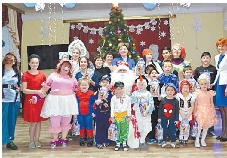
■ Праздники проходят здесь весело.