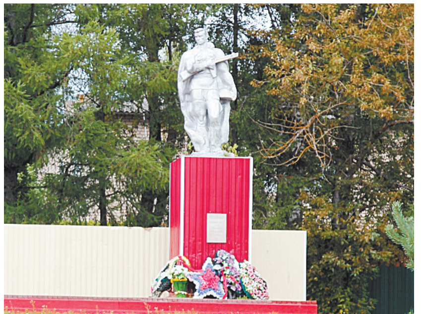
■ Памятник воину-освободителю.