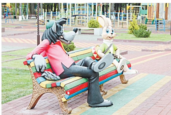
■ На этой лавочке можно почувствовать себя героем мультфильма.