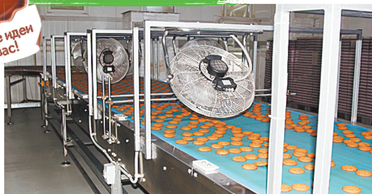
■ В цехах установлено современное европейское оборудование.