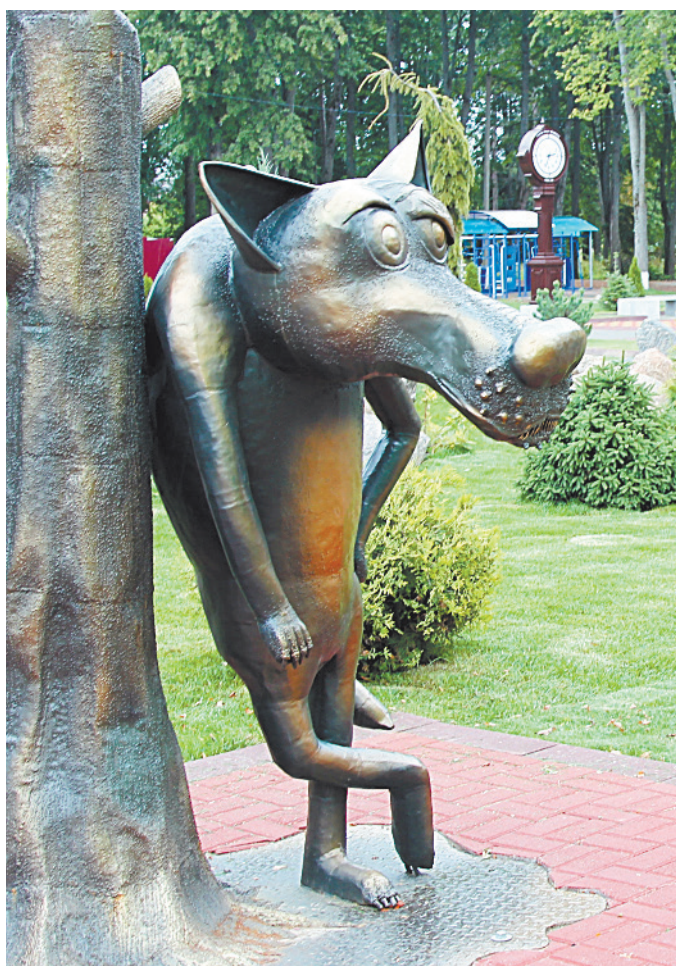
■ Совсем нестрашный серый волк.

К новому учебному году в городе реконструировали школу № 2. Год назад здесь завершился капи-