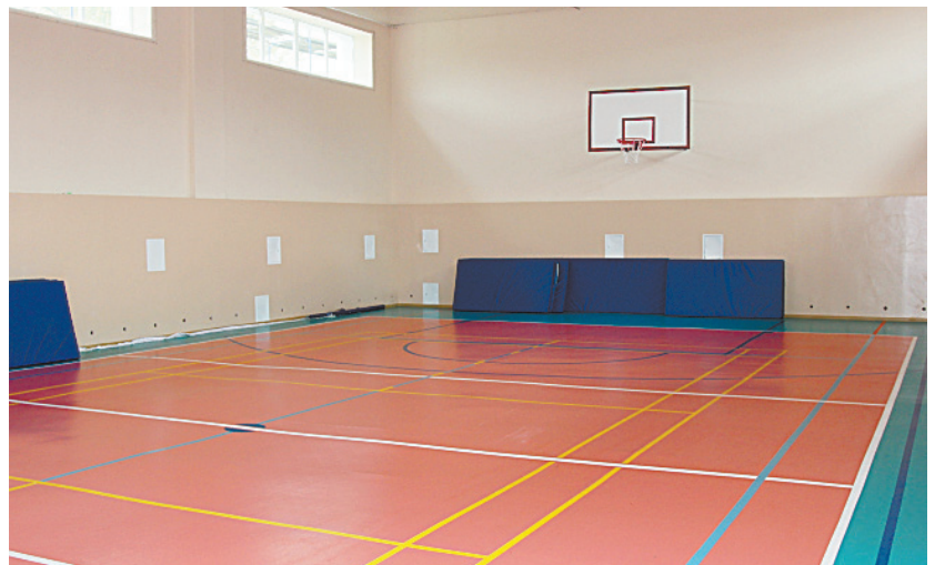
■ Спортивный зал школы № 2.

компании. С прошлого года здесь идет планомерное благоустройство по федеральной программе «Парки малых городов»: сделали дорожки, установили альпийскую горку, детские игровые площадки. Дети и взрослые с удовольствием фотографируются с декоративными зелеными скульптурами медведей, а те, кто приходит сюда впервые, улыбаются, слышав голос другой здешней достопримечательности — волка из мультфильма «Жил-был пес», который произносит культовую фразу: «Ты это... заходи, если что». Городской парк стал популярным местом и у любителей спорта: здесь можно поиграть в футбол (покрытие поля такое же, как на стадионе чемпионата мира), в бадминтон, волейбол и баскетбол. Еще здесь появилась сцена для концертов, ведь в парке теперь регулярно проходят городские праздники. Можно посоревноваться в меткости в новом тире. В общем, найдется занятие по душе для каждого. А главное, работы в парке продолжаются: власти обещают в ближайшем будущем устроить здесь пруд — на радость местным жителям и на зависть соседям.