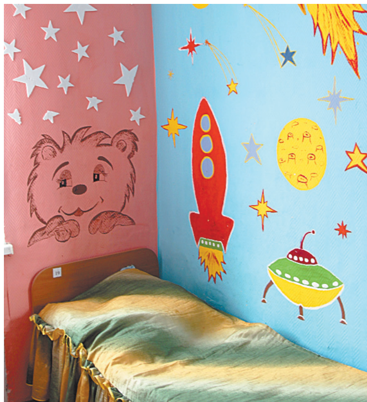
■ В центре всегда уютно и комфортно.