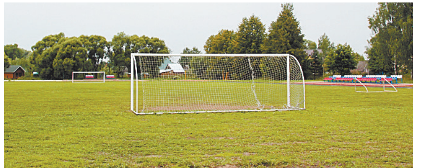
■ В Спас-Деменске любят спорт, в том числе и футбол.