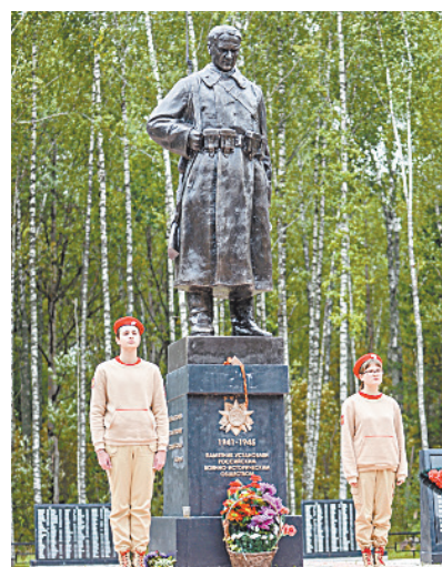
■ У памятника советскому солдату часто проводят мероприятия юнармейцы.

ческое общество. На комплексе установлены пилоны с нанесенными на них именами и фамилиями защитников Родины, погибших за ее освобождение. Комплекс «Гнездиловская высота» включен в состав объектов культурного наследия регионального значения. Расположенные в этой местности деревни Жданово, Гнездилово, село Павлиново носят почетное звание «Рубеж воинской доблести». Каждый год поисковики поднимают из земли новые останки, ведутся постоянные работы по установлению личности каждого погибшего бойца.