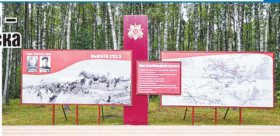
■ На стенде желающие могут подробно изучить детали освободительной операции.