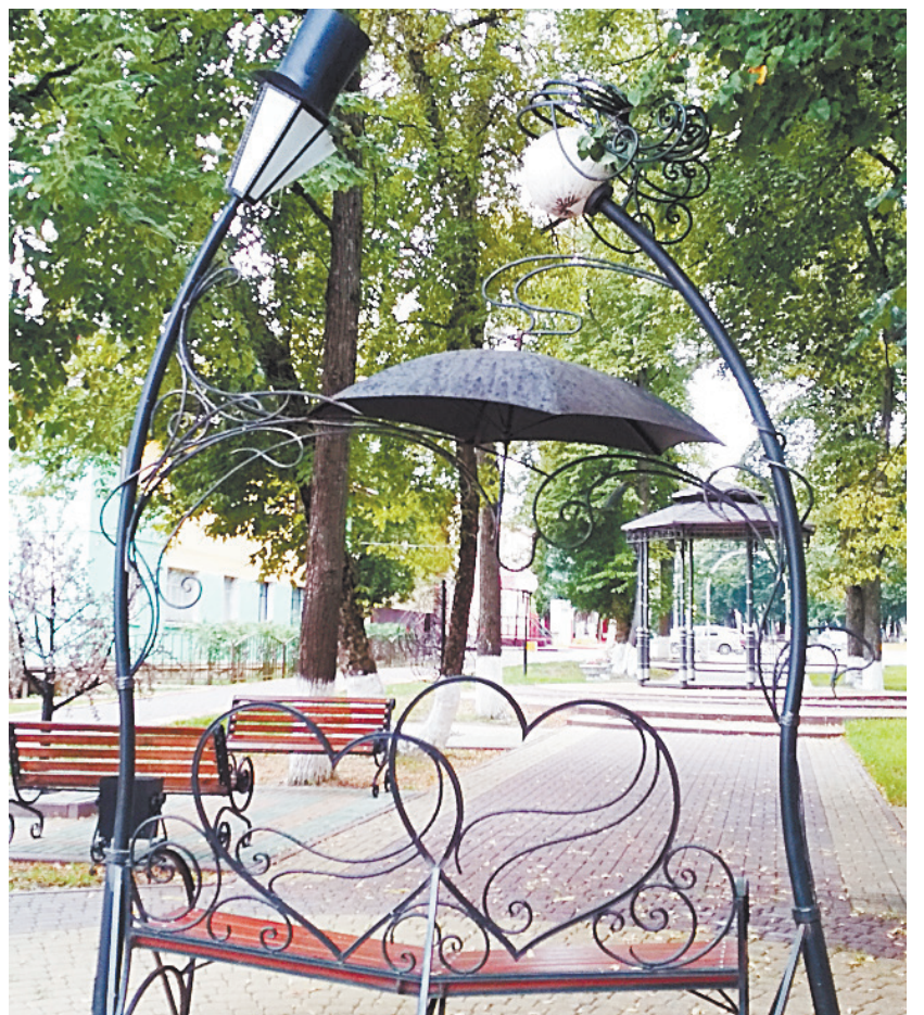
■ Излюбленное место фотосессий молодоженов.