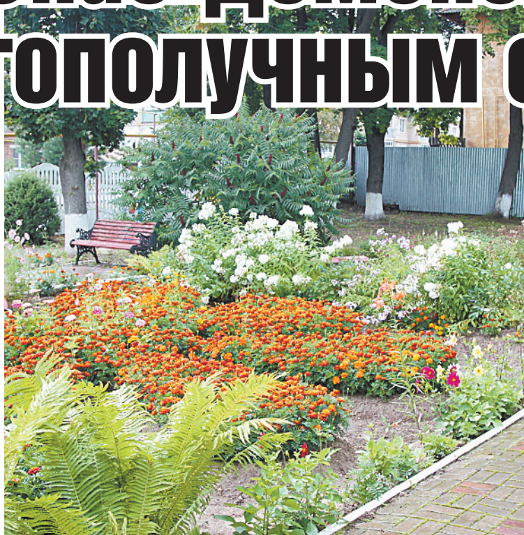
■ Территорию центра воспитанники и воспитатели облагораживают сами.

К сожалению, неблагополучные семьи и трудные подростки до сих пор остаются у нас в стране серьезной проблемой. При этом в некоторых городах применяются успешные практики по ее решению. Например, в Спас-Деменске вот уже 20 лет действует социально-реабилитационный центр для несовершеннолетних «Черемушки». О его работе красноречиво говорит тот факт, что те, кто проходил здесь реабилитацию два десятилетия назад, уже построили собственные семьи. То есть выпускники действительно получают положительную модель дальнейшей социальной жизни.