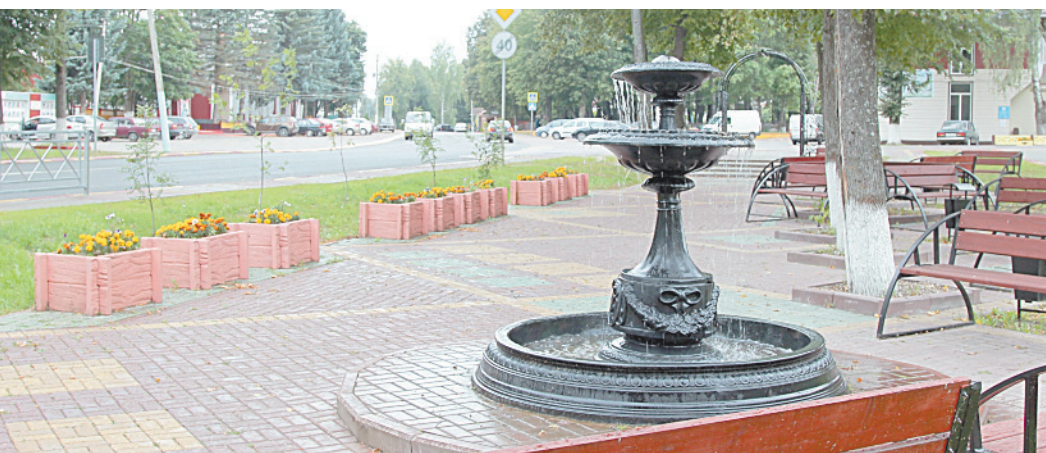
■ В городе много фонтанов.