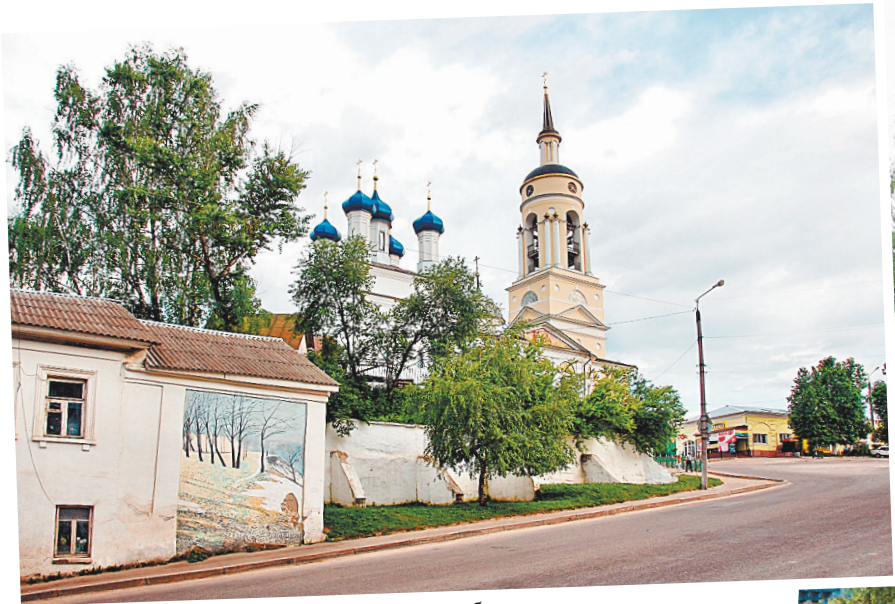
■ Боровск — это музей под открытым небом.

Боровск — это своеобразный музей под открытым небом. Его планировка и архитектура типичны для многих уездных городов дореволю-