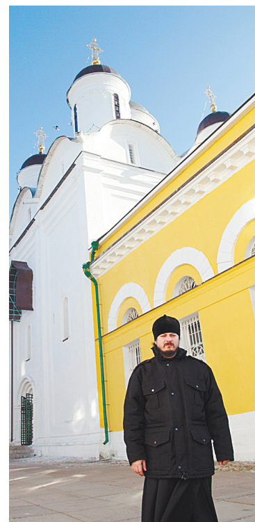
■ Иеромонах Фотий.

Здесь можно не только отдохнуть вдаль от городской суеты, но и порыбачить, покататься на лошадях, посетить мини-зоопарк, баню, поиграть в разные игры, уделить внимание здоровью,