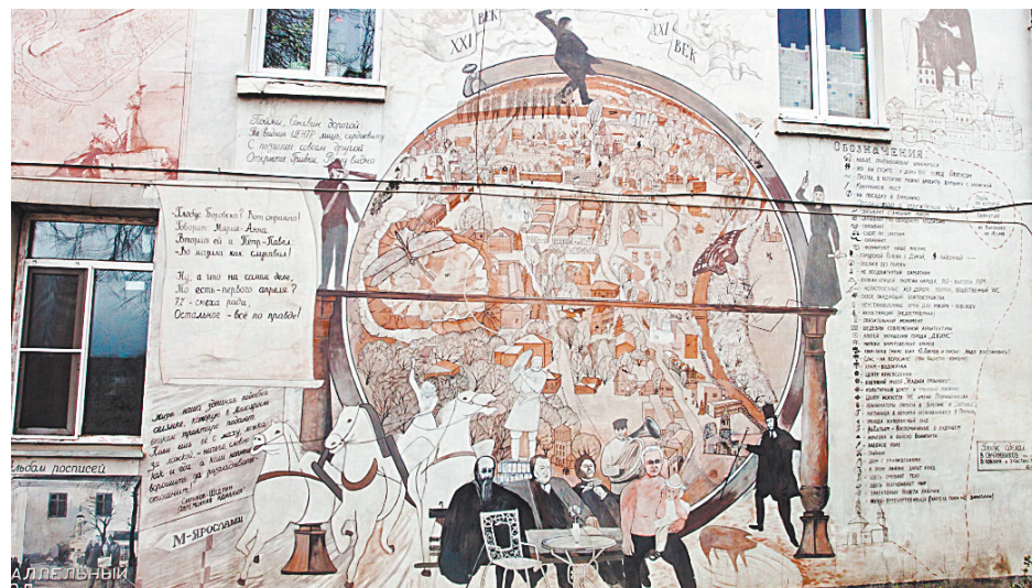
■ Стены домов превратились в картинную галерею.