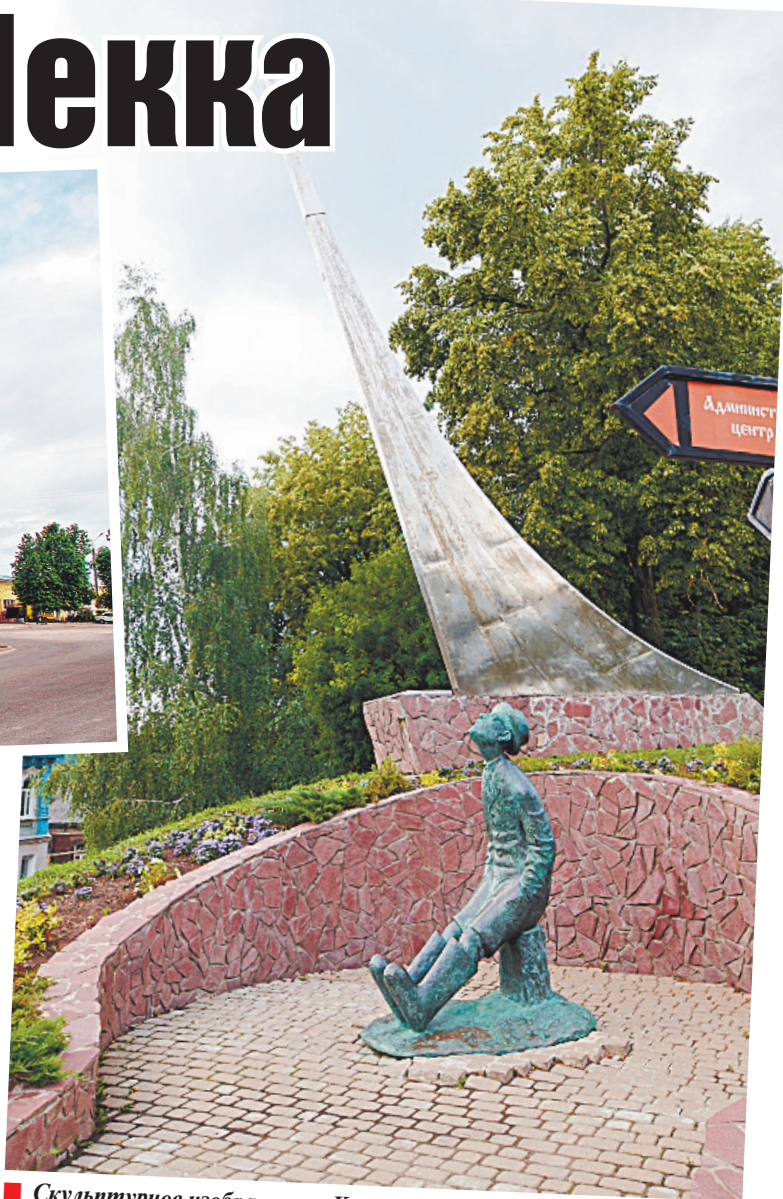
■ Скульптурное изображение Константина Циолковского.

В Боровском уездном училище в разное время преподавали основоположник отечественной космонавтики Константин Циолковский, издавший в Боровске свой первый научный труд, и философ Николай Федоров, автор казавшейся тогда утопической идеи расшифровки генетического кода человечества. В городе именитым землякам — К.Э. Циолковскому и Н.Ф. Федорову — установлены