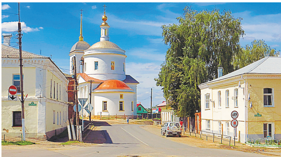
■ По городу можно бродить часами, все время открывая для себя что-то новое.

И нам думается, что вскоре здесь интересных мест станет еще больше. Ведь администрация района активно ищет инвесторов, готовых открывать в городе музеи, галереи, различные арт-пространства.