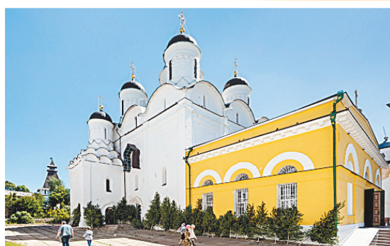
■ Свято-Пафнутьев Боровский монастырь.

Туристическую привлекательность Боровскому району придает расположенный на его территории Культурно-образовательный туристический центр «Этномир», учрежденный Фондом «Диалог культур — единый мир».