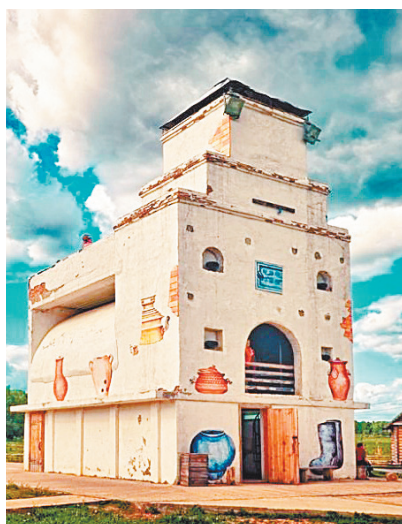
■ В «Этномире» есть и такие необычные объекты.

Небольшие живописные деревеньки, потрясающие виды с холмов на старинные храмы, тишина... Что еще нужно, чтобы сделать отдых по-настоящему запоминающимся?