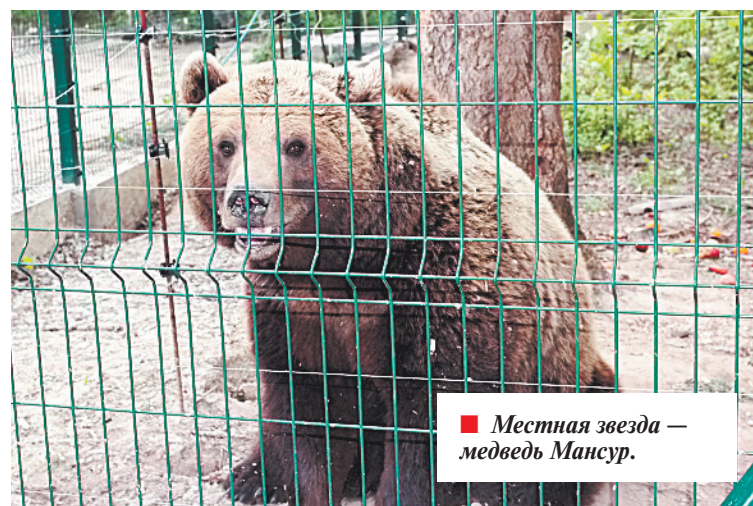
■ Местная звезда — медведь Мансур.