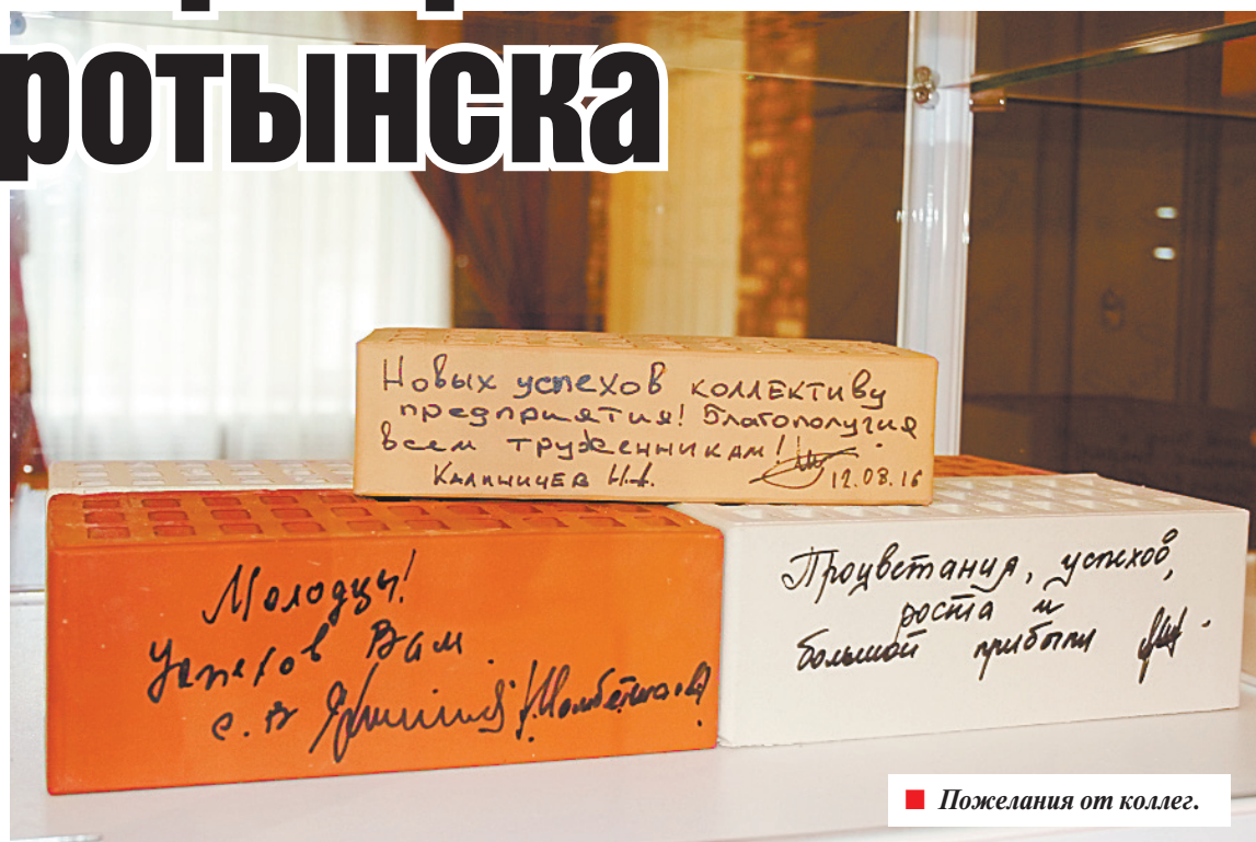
■ Пожелания от коллег.

для клиента высокое качество продукции по доступным ценам. На заводе осуществляется технологический контроль на всех этапах производства, соблюдаются все требования и нормативы, в том числе и международные. Каждая партия готового кирпича обязательно сопровождается сертификатом соответствия, санитарно-эпидемиологическим заключением и, конечно, паспортом качества. В зависимости от объема и условий поставок клиент может рассчитывать на дополнительные скидки. Все это и делает воротынский кирпич таким популярным: по всей стране, от Калининграда до Благовещенска, из произведенных здесь материалов возведены сотни тысяч квадратных метров жилья.