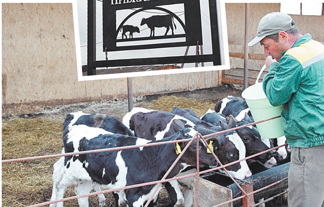
■ Телята на ферме содержатся отдельно.