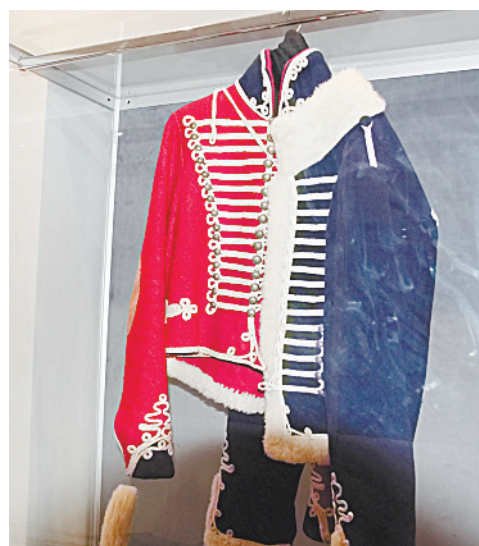
■ Костюм времен войны 1812 г.