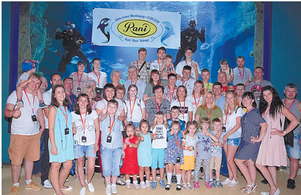
■ Корпоративная семейная поездка в Москву.

*Нейминг — процесс разработки названия бренда для компании.