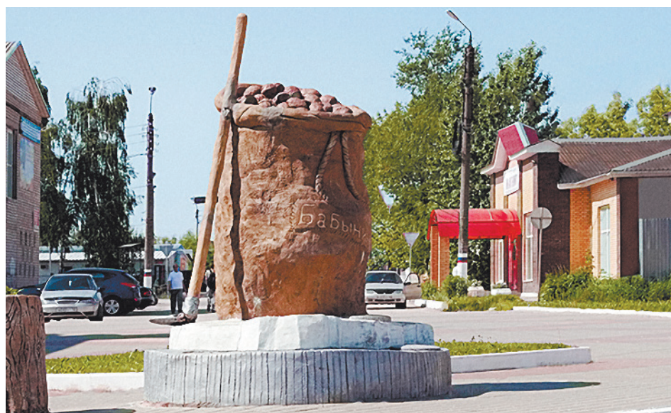
■ Памятник картофелю в п. Бабынино.