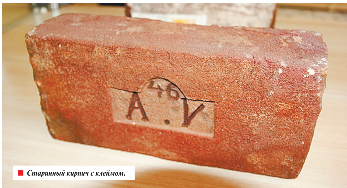
■ Старинный кирпич с клеймом.

Россия, 249201, Калужская область, Бабынинский район, пос. Воротынский, ул. Заводская, 1.