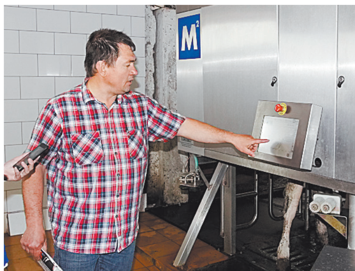
■ На ферме Пивкина установлены современные доильные роботы.

В 2014 году предприниматели решили организовать свое «показательное» хозяйство, где можно наглядно продемонстрировать технологию выращивания основных сельскохозяйственных культур. Но на этом они не остановились. В 2015 году хозяйство получило грант на развитие семейной животноводческой фермы на базе крестьянского (фермерского) хозяйства. Хозяйство стало участником областной программы «100 роботизированных ферм». В рамках реализации проекта проведена реконструкция молочной фермы, приобретены и смонтированы роботизированные установки системы Fullwood Merlin (Англия), завезен племенной скот КРС (нетели) голштинской породы в количестве 131 головы.