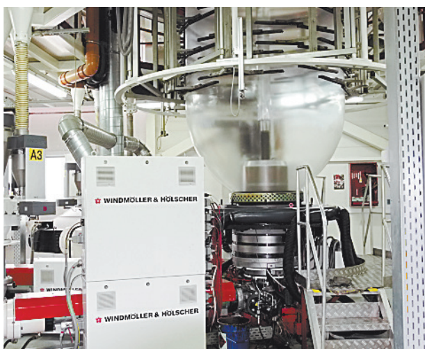
■ Производство оснащено современным экструзионным оборудованием.