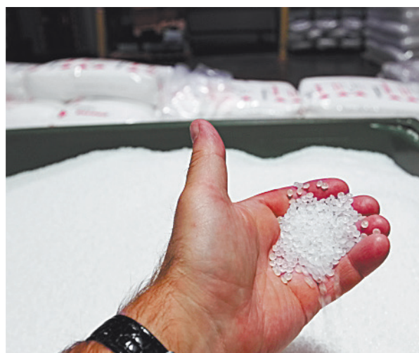
■ Сырье поступает в Rani Plast в форме гранул размером с зернышко риса.