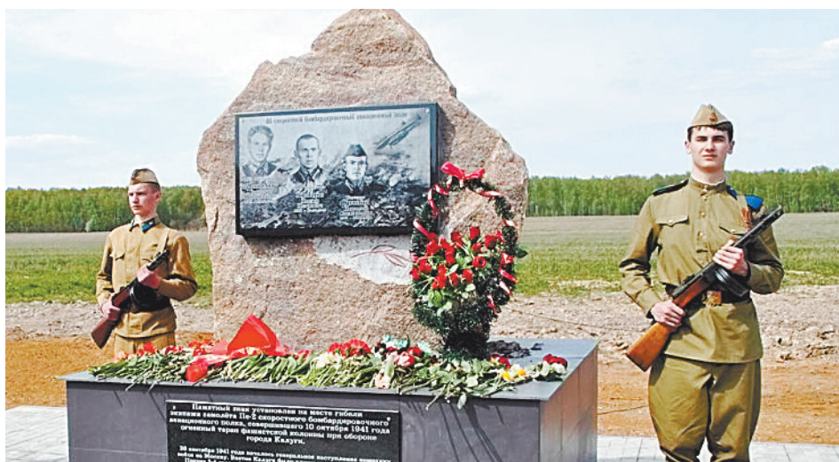
■ Памятный знак, установленный на месте гибели экипажа Пе-2, совершившего 10 октября 1941 года при обороне Калуги огненный таран фашистской колонны. Д. Космачи.