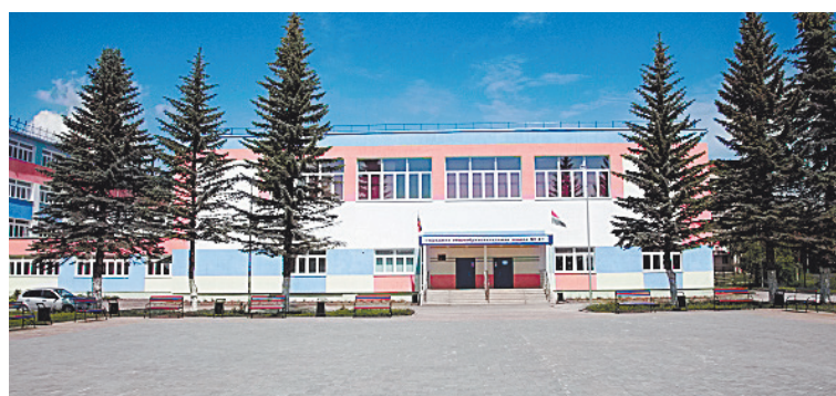
■ Корпус Бабынинской средней школы № 2 по ул. В. Анохина (п. Бабынино) после капитального ремонта.