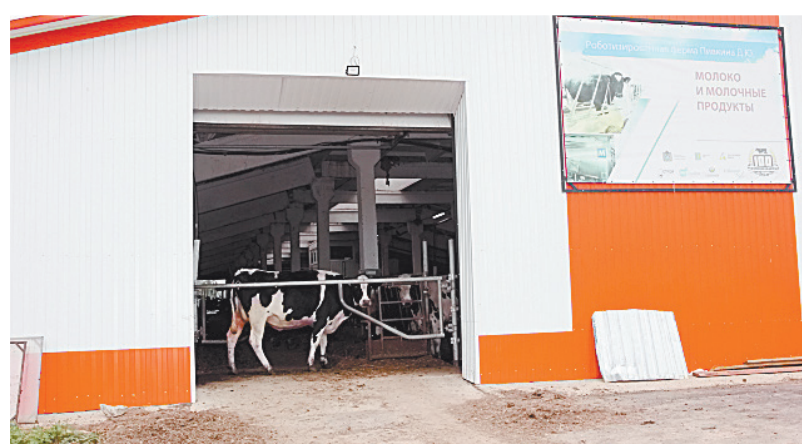
■ Скоро рядом появится еще и мясная ферма.