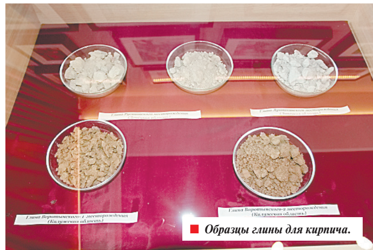
■ Образцы глины для кирпича.