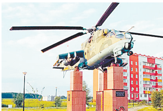
■ Вертолет Ми-24 в сквере Авиаторов в п. Воротынский.