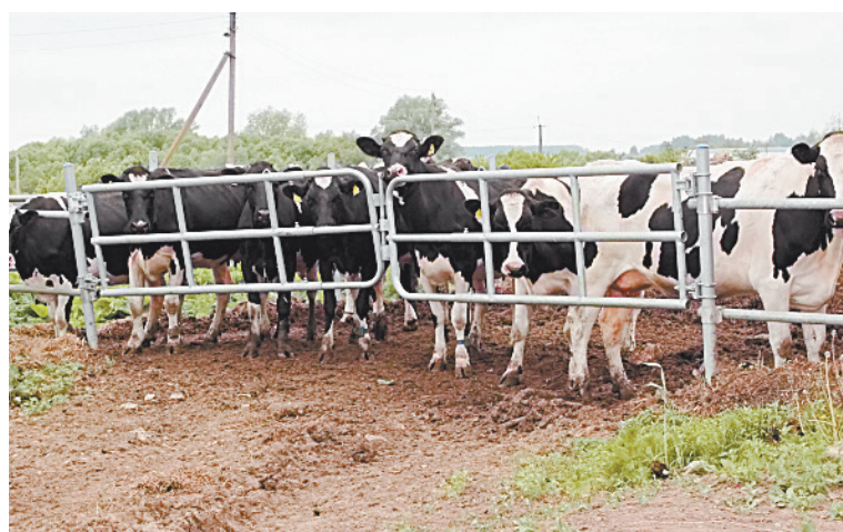
■ Все коровы прибыли в Бабынинский район из Дании.

Калужская область, Бабынинский район, село Пятницкое. Тел.: 89036964906.