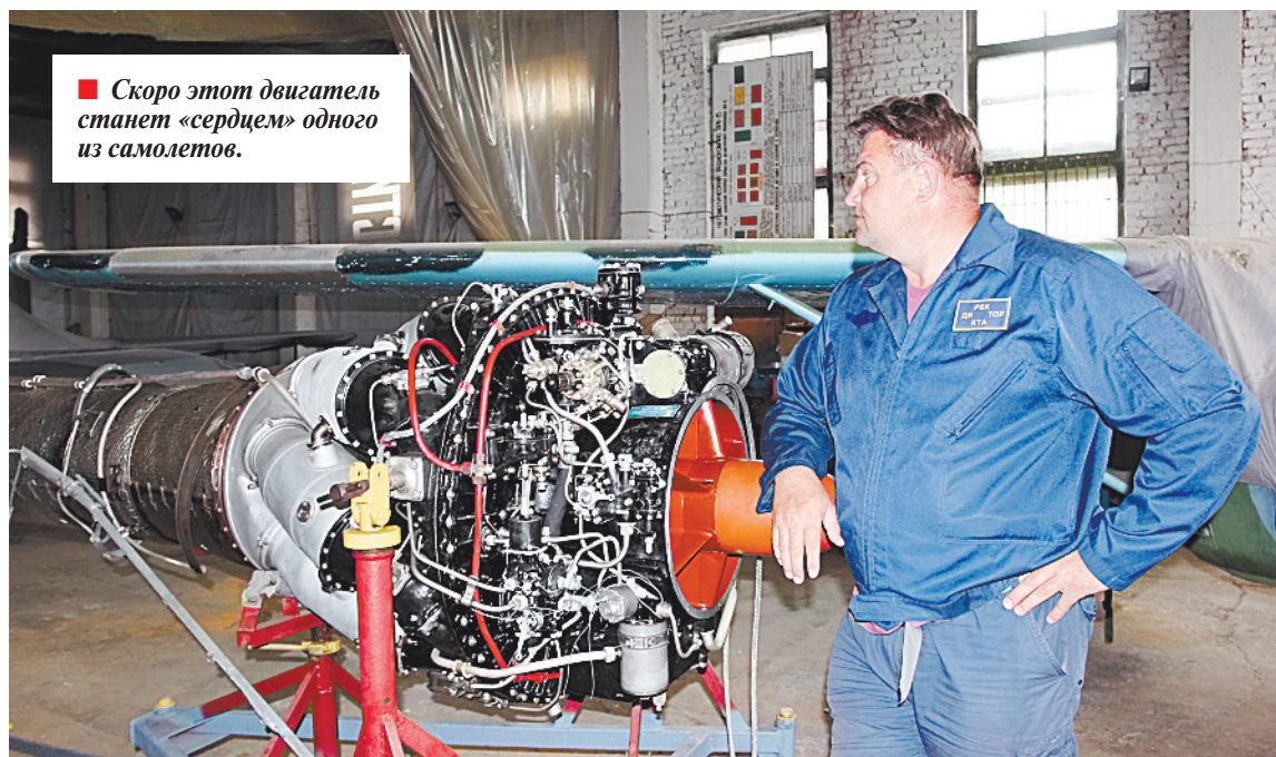
■ Скоро этот двигатель станет «сердцем» одного из самолетов.