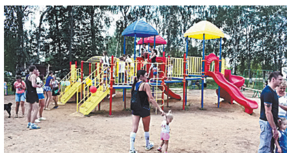
■ Детская игровая площадка в сквере на улице Строительной в п. Бабынино. Ее установили в рамках подпрограммы «Устойчивое развитие сельских территорий Калужской области».