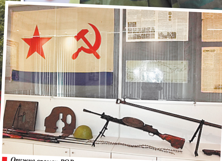
■ Оружие времен ВОВ.

ничных походах русской армии. Вот так совсем небольшое калужское село каждой из Отечественных войн дало своего генерала. Ну а главный памятник семье Деляновых — это, пожалуй, храм в Утешево. Его построили по распоряжению жены Давида Артемьевича Марии Екимовны. А поскольку Деляновы происходили из армянского аристократического рода, то и местный храм