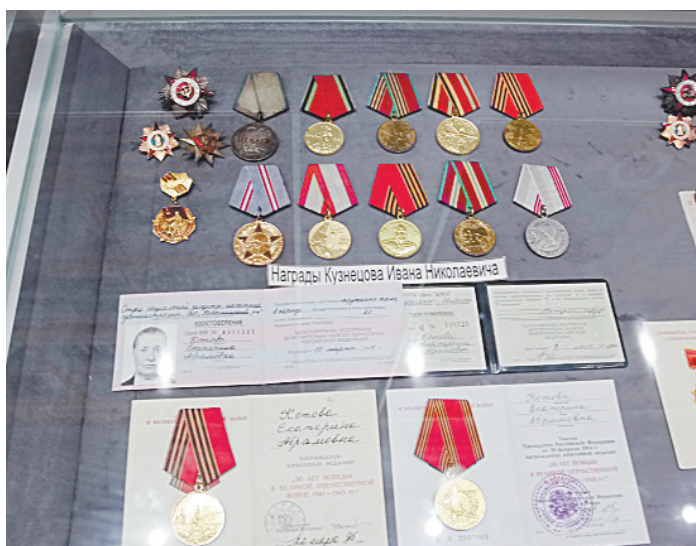
■ Награды ветеранов — уроженцев села.