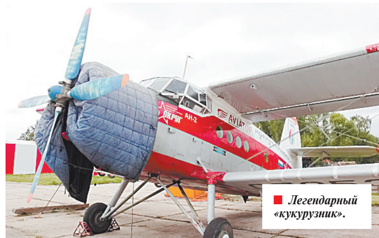
■ Легендарный «кукурузник».

249200, Калужская область, пос. Воротынский, ул. Аэродромная, 6. Тел.: +7(916)060-94-04, +7(925)740-3454 www.l-39.aero