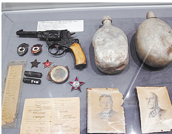
■ Часть находок музея дарят поисковики.

Кто знает, может быть, в Утешево появится еще один генерал!