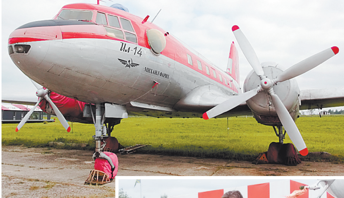
■ Знаменитый Ил-14 «Пингвин».

Помимо стальных экспонатов в «Орешково» есть еще одна знаменитость — медведь Мансур. Его подбросили пилотам совсем маленьким, и выяснилось, что в дикую природу зверя уже не вернуть — слишком привык к людям. Конечно, животное попытались пристроить, и быстро нашлись «добрые люди», пообещавшие отвезти Мансура в за-