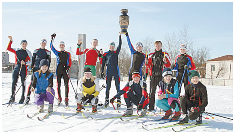
■ Первый кубок губернатора — у людиновских лыжников.

Предприятие активно участвует в жизни родного города, проводит разные социальные мероприятия для жителей Людиново и благотворительные акции. Каждый день здесь насыщен событиями. Но только достигнутыми успехами жить нельзя. На заводе считают, что важно опережать события, оперативно реагировать на происходящие в отрасли изменения, добиваясь высоких результатов.