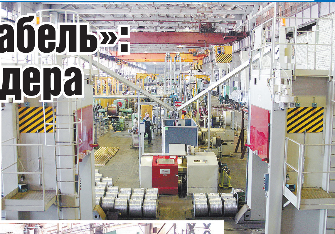
■ Современное производство.

«Людиновокабель» не просто динамично развивающееся предприятие — это бренд. Предприятие входит в десятку крупнейших производителей кабельно-проводниковой продукции России. За более чем 25-летнюю историю завод завоевал безупречную репутацию, с ним хотят сотрудничать партнеры и клиенты — все это благодаря отлаженной и качественной