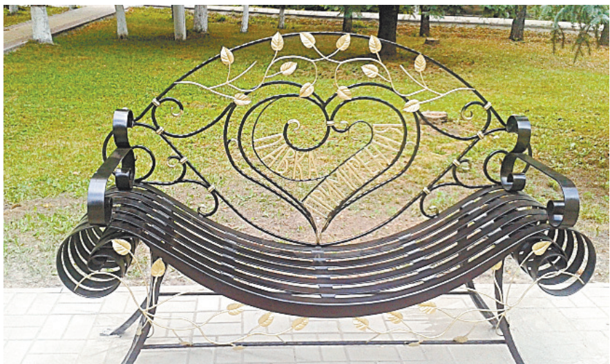
■ «Скамья примирения и согласия».