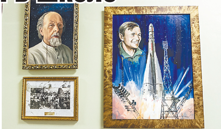
■ Картинная галерея в школе.