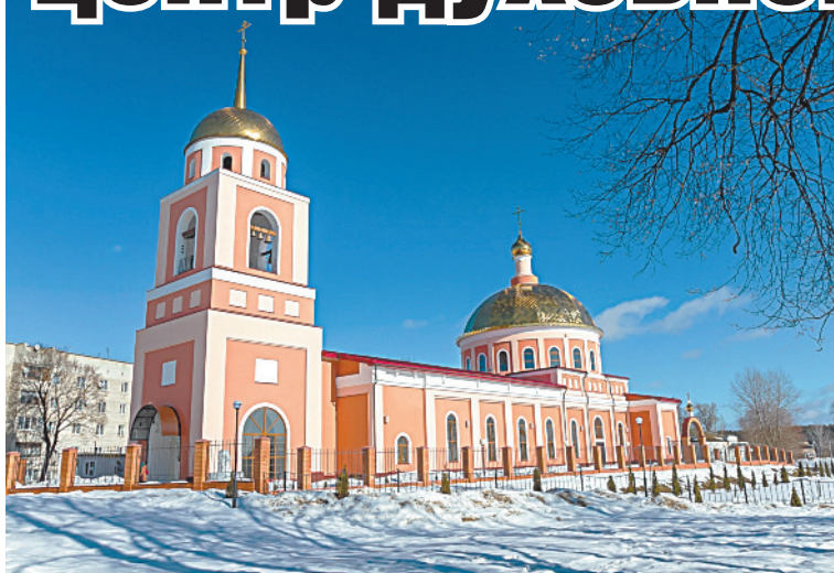
■ Храм в честь Святого Александра Невского.

Коровчане отмечают, что их город стал центром духовной жизни. Сюда стремятся