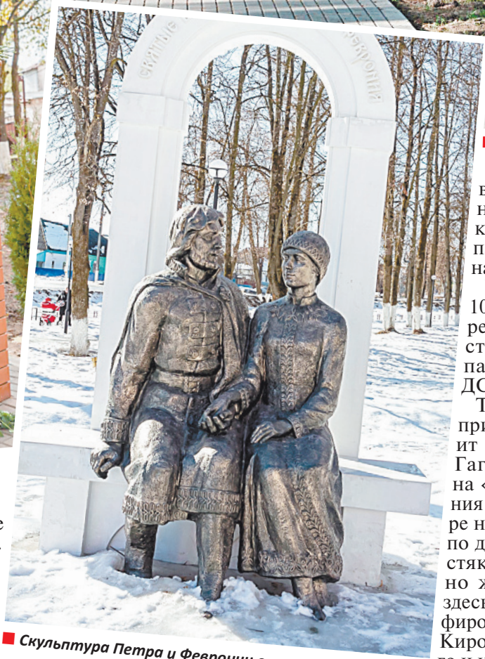
■ Скульптура Петра и Февронии в сквере Керамиков.