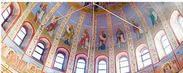
■ Роспись собора.

попасть паломники из разных уголков нашего региона.