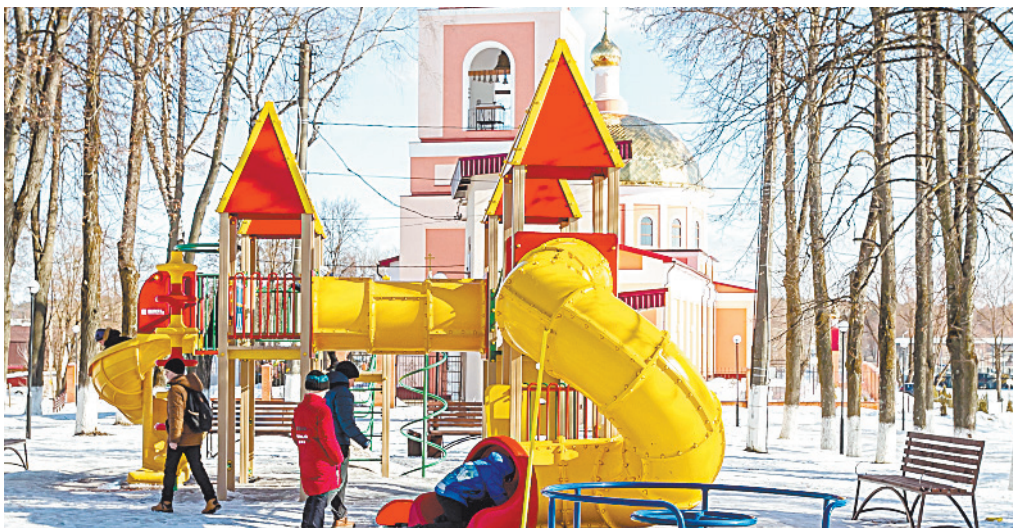
■ В городе появилось много игровых комплексов.