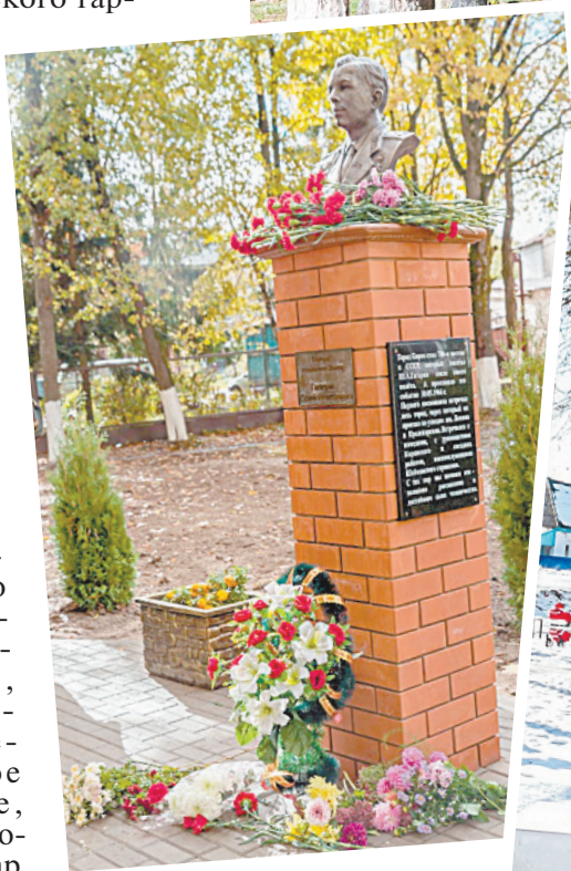
■ Сквер Гагарина.