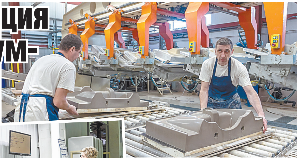
■ Литейные машины высокого давления позволяют оптимизировать труд.

Современное оборудование вкупе с новейшими технологиями позволили достичь значительных результатов за короткие сроки. В 2015 году начался выпуск продукции. Изначально здесь производили порядка 6,5 тысячи изделий в месяц.