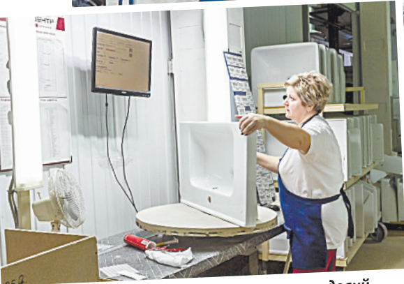
■ Особое внимание уделяется качеству изделий.

Всего каких-то 4 года назад на предприятии изготавливалось лишь 10 видов умывальников, сейчас — порядка 38. А максимальная мощность производства достигла 15 тысяч изделий.